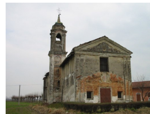
Santuario del Cristo http://www.comune.scarnafigi.cn.it