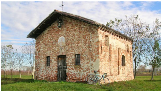
Cappella della S.S. Trinità, http://www.comune.scarnafigi.cn.it