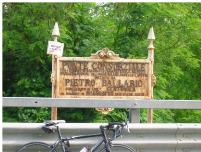
Pietro Ballario ponte sul Varaita https://mapio.net