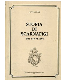
Ettore Dao Storia di Scarnafigi