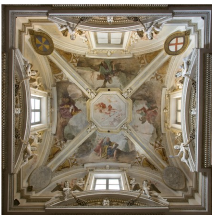
Cappella del Santo Sudario http://www.cittaecattedrali.it

Il progetto prevede in primo luogo un censimento riguardante l'effettiva fruibilità e accessibilità del bene (assenza/presenza di barriere architettoniche, distanza dal centro del paese, orari e modalità di apertura,...). In contemporanea, si procederà con la misurazione del livello di conoscenza riguardante la presenza di beni di interesse culturale da parte degli abitanti del territorio (questionari cartacei e online, interviste, sondaggi,...). Terminata la raccolta dei dati, il progetto prevede la creazione, da parte dei destinatari del modulo, di un'area digitale connessa al sito comunale di Scarnafigi e una pagina Facebook dedicata, il tutto finalizzato alla divulgazione , non solo locale, dell'offerta turistico-culturale di Scarnafigi . Questo lavoro in rete deve contenere anche tutte le informazioni relative all'effettiva accessibilità e fruibilità del bene (segnaletica, orari di apertura, audio-guide, pannelli informativi multilingue, geolocalizzazione del bene, livelli di difficoltà del percorso, aree di ristoro e servizi,...). Contestualmente i destinatari del modulo dovranno avanzare proposte di miglioramento riguardanti l'accessibilità stessa, da presentare agli enti territoriali competenti.