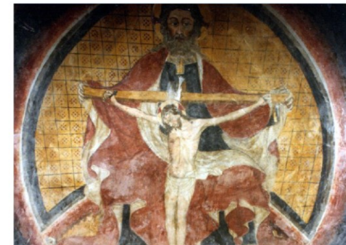
Cappella della S.S. Trinità, affresco di fine del XV secolo https://scrittorediscrittura.it