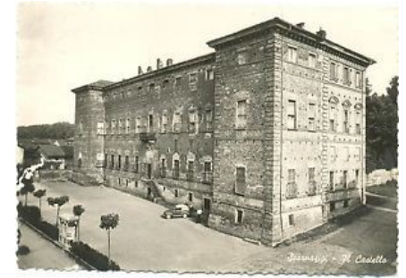
Castello di Scarnafigi famiglia De Ponte