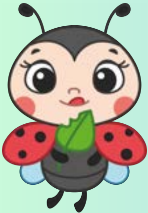
COCCINELLE Sez C