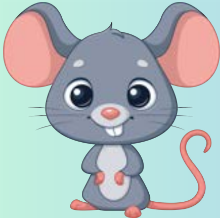
TOPOLINI Sez A