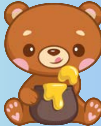
ORSETTI Sez B