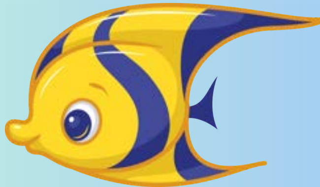
PESCIOLINI Sez D