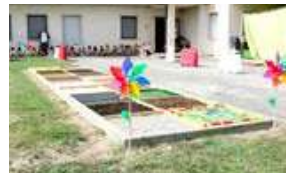
principali sostenitori del percorso sensoriale.

MORETTA All'interno del cortile della scuola trova spazio anche un percorso sensoriale, anch'esso di recente realizzazione. Il percorso, costituito da "scoperti" contenenti diversi elementi naturali, permette al bambino di entrare a piedi nudi e nasce con l'intento di far apprendere le diversità degli elementi naturali con i sensi, in particolare il tatto. Una proposta per i piccoli dell'infanzia, anch'essa divenuta realtà, grazie al prezioso interessamento dei genitori, tra i