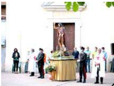
La celebrazione religiosa che ha aperto l'edizione 2021

MORETTA Domani sera (venerdì 24), in occasione dell'apertura dei festeggiamenti patronali per San Giovanni Battista, ritornerà la processione, che partirà alle 20. Il percorso, muovendo dalla chiesa parrocchiale, si snoderà lungo piazza Umberto I, via Torino, via Craveri, via Riobello, via Macario, via Pallieri, via Mogna, via Santuario, per concludersi su piazza Castello. Qui, alle 20,45 sarà celebrata la messa. A seguire, inaugurazione ufficiale della festa, consegna del "Premio San Giovanni" e rinfresco offerto dalla Pro Loco.