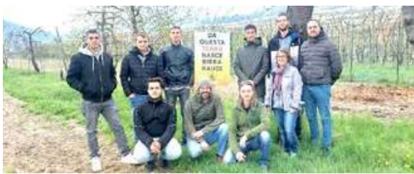
Alcuni corsisti Agenform impegnati direttamente sul campo, dove nasce la birra Kauss

MORETTA Dall'unione tra le tecniche di salumeria di Agenform e la birra artigianale Kauss nasce lo "SpecKauss", prodotto realizzato negli ultimi mesi nei laboratori del centro di formazione morettese, in stretta collaborazione con l'azienda sorta in valle Varaita esattamente dieci anni fa. "Just Meat" è il nome della cooperativa didattica formata dagli allievi del corso tecnico specializzato nella produzione - Carni e Salumi 2021-2022. Gli studenti, nell'ambito delle attività di simulazione cooperativa, hanno avuto modo di conoscere diverse realtà imprenditoriali, tra cui il birrifico agricolo