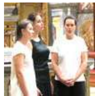
Le ospiti ucraine